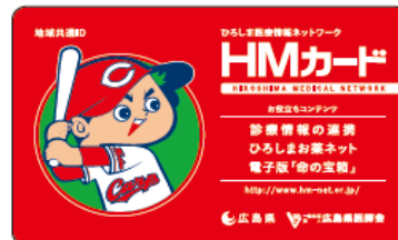
■キャンペーン中発行のカード