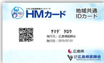
■通常時発行のカード