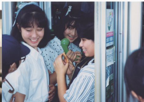
「若人よ いのちと愛のメッセージ」