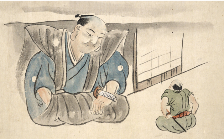
『(仮称) 稲享物怪録絵巻』(部分) 江戸時代