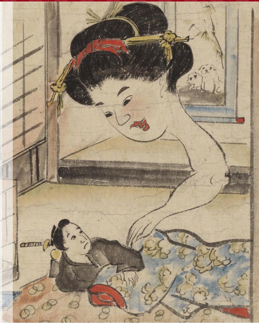
『(仮称) 稲生物怪録絵巻 [堀田家本]』(部分) 江戸時代