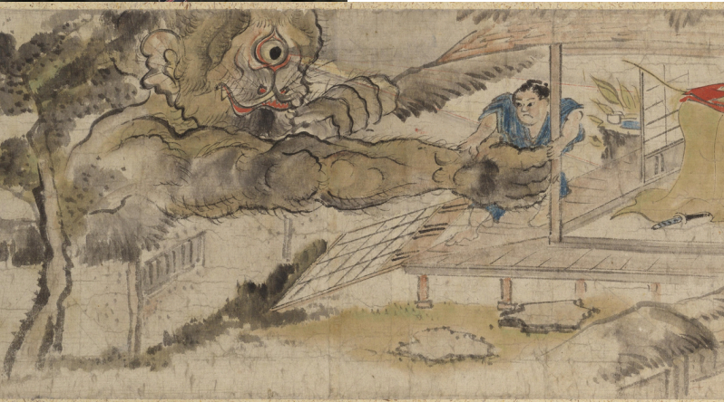
『(仮称) 稲生物怪録絵巻 [堀田家本]』(部分) 江戸時代 ※掲載資料はすべて湯本豪一記念日本妖怪博物館所蔵